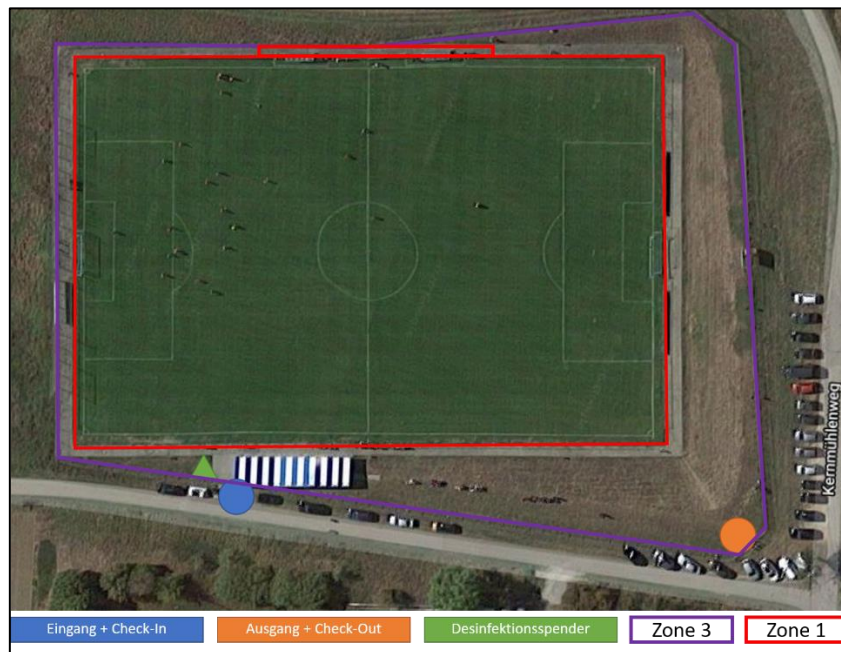
Abbildung 2: Rasenspielfeld „D-Platz“