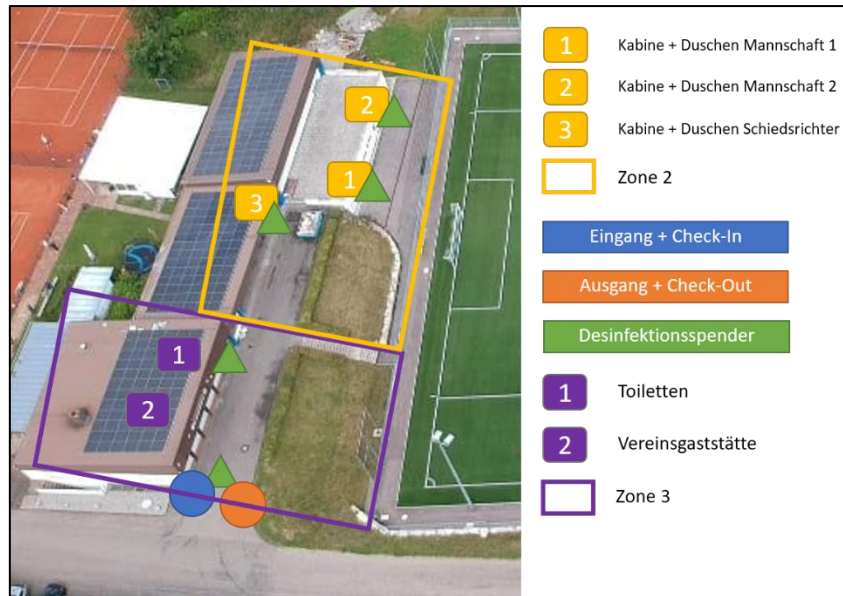
Abbildung 1: Umkleiden + Vereinsheim