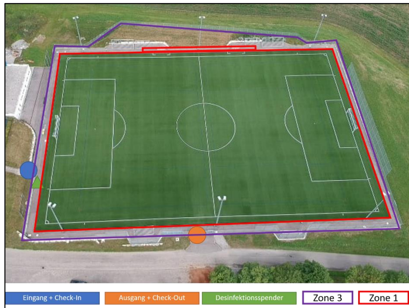
Abbildung 3: Kunstrasenspielfeld „B-Platz“